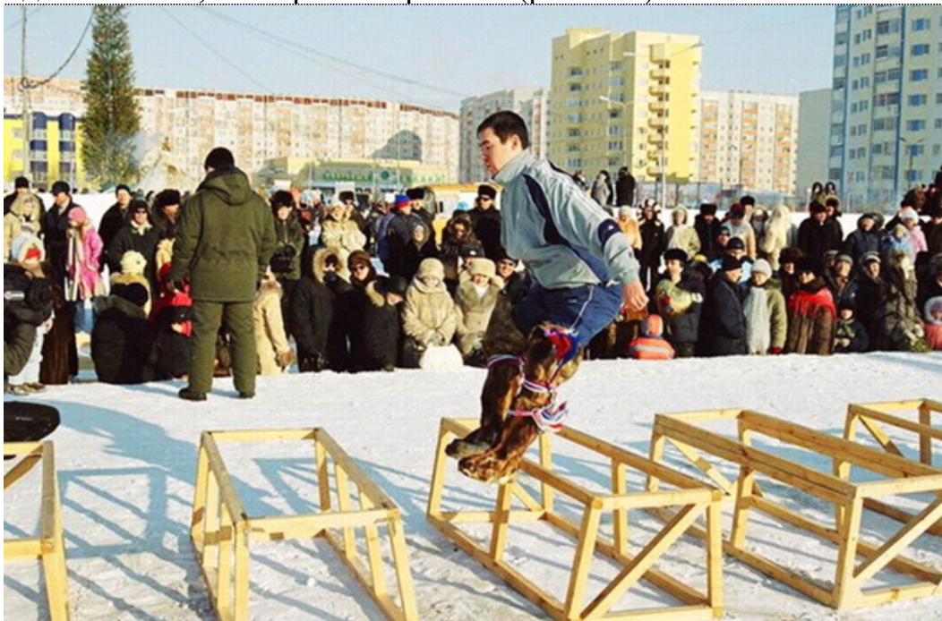
Рис. N 6 - фотография нарты

Нарты располагаются на ровной местности 10 нарты в ряд на расстоянии 55 см для юношей, юниоров и взрослых (рис. N 6).